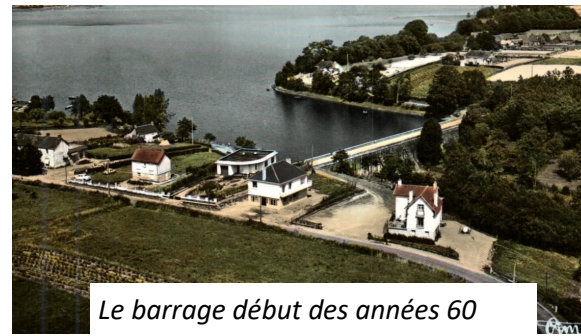
Le barrage début des années 60

Conclusion : Si le développement du chemin de fer puis l'amélioration du réseau routier ont marqué le déclin des activités de transport sur le canal, celui-ci est maintenant un atout important pour le tourisme fluvial, ou en vélo. Les nouveaux circuits comme celui de la « Régalante » ont déjà un réel succès. Et bien sûr Vioreau, plus globalement notre commune de Joué/Erdre, les Pays d'Ancenis et de Châteaubriant, grâce à ce beau barrage qui assure l'avenir, bénéficient de ce développement et permettent à tous la découverte de notre belle région. (Extrait du discours du Maire lors de l'inauguration du barrage. Recherches: Stan Hardy)